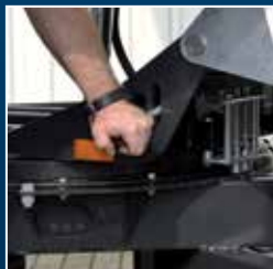
Couronne pivotante réglable, avec blocage à déblocage mécanique