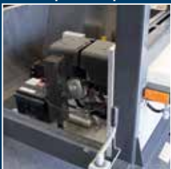
Moteur d'entraînement Honda économique et réservoir volumineux