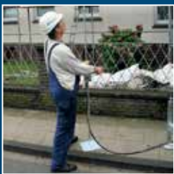
Vue permanente sur les charges grâce à la télécommande mécanique (en option)