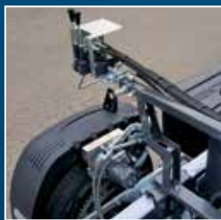
Entraînement des roues automoteur performant (en option)